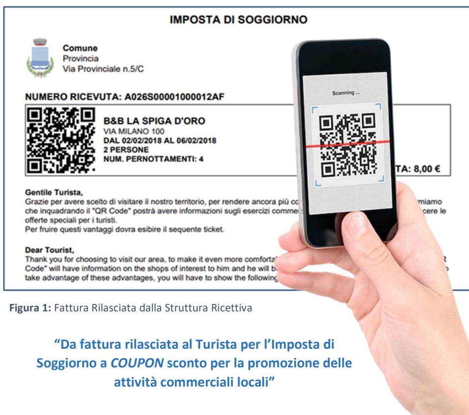
Figura 1: Fattura Rilasciata dalla Struttura Ricettiva

Con OPENTourist infatti il turista nella ricevuta rilasciata dall'albergatore troverà un QRCode che gli permetterà di poter usufruire di sconti e promozioni presso gli esercenti locali che aderiscono all'iniziativa.